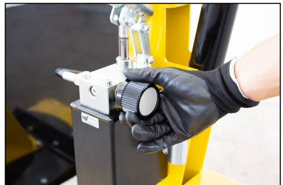
Detalle de la bomba manual y perilla

El modelo 01M2 al ser una grúa con elevación manual no requiere una certificación de terceros según la legislación vigente ni obligación de controles periódicos.